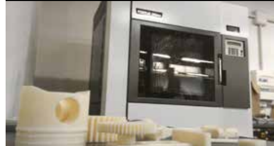
imprimante 3D (investissement 2014)