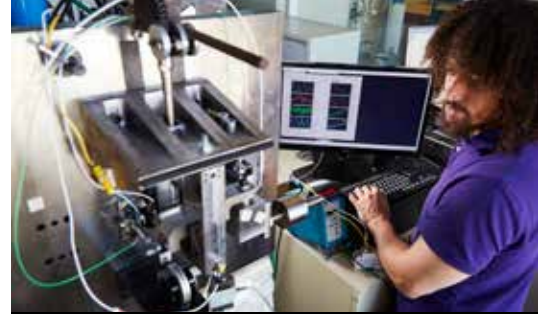
mise en place d'un project center d'un lean lab et d'un fab lab

*CFAI MECAVENIR 92800 Puteaux : CFA partenaire de Supméca pour les ingénieurs par apprentissage