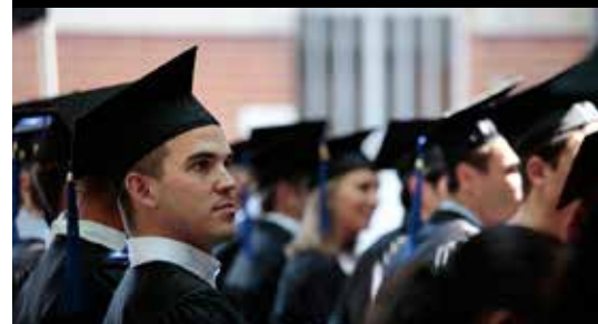
plus de 240 ingénieurs diplômés par an