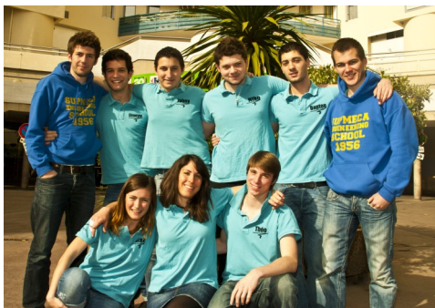
La nouvelle équipe du BDE Toulon