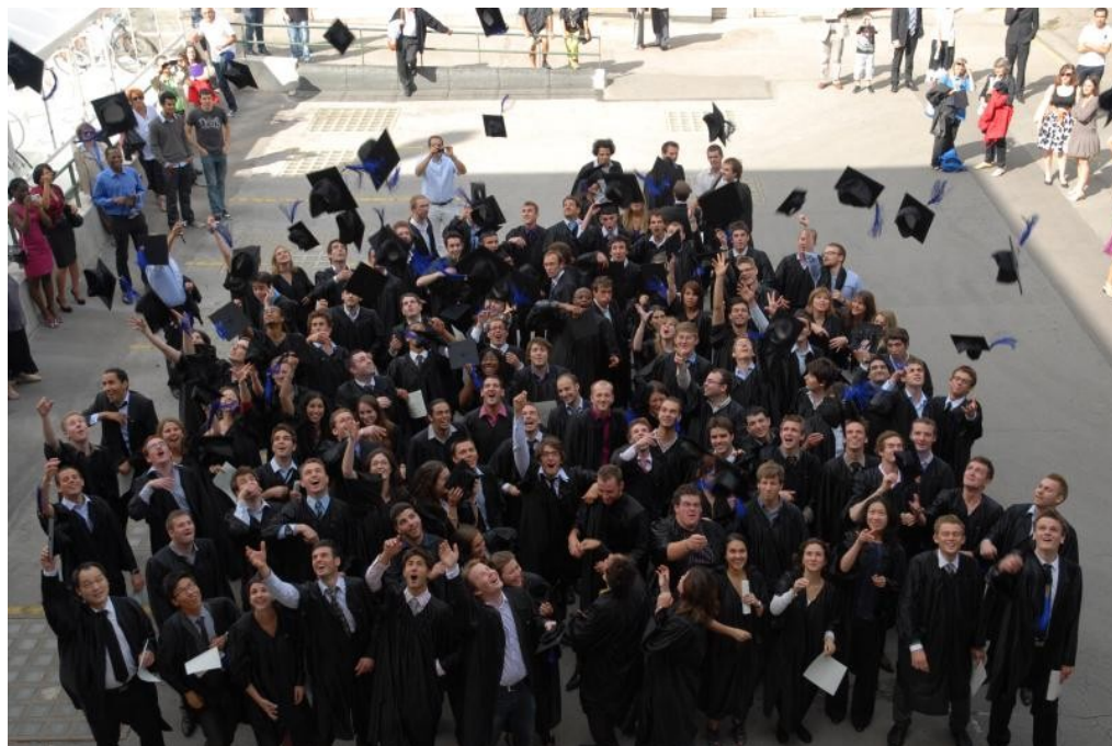
La promotion 2010 après la remise des diplômes le 25 juin à Saint Ouen