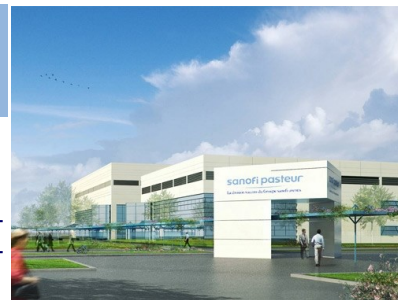
Vue d'architecte du site Sanofi Pasteur

*La dengue, maladie transmise par les moustiques, représente une menace pour près de la moitié de la population mondiale. Elle survient essentiellement dans les régions tropicales et subtropicales. Il n'existe aucun traitement spécifique et la vaccination représente le seul moyen efficace de lutte contre cette maladie infectieuse.