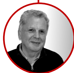
ANNUAIRE Michel MIRJOL