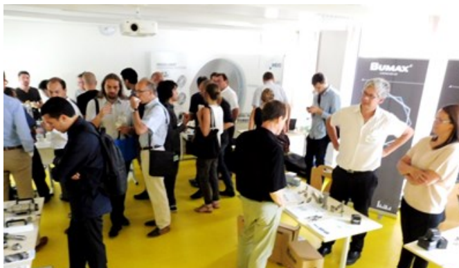
Une vue partielle de l'exposition en 2015

La diversité et la pertinence des thèmes qui seront abordés permettent d'espérer une large audience et des échanges animés et fructueux.