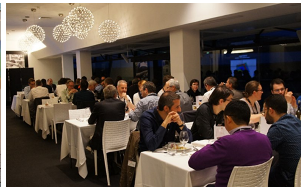
Soirée de gala, avec dîner au restaurant du stade de France