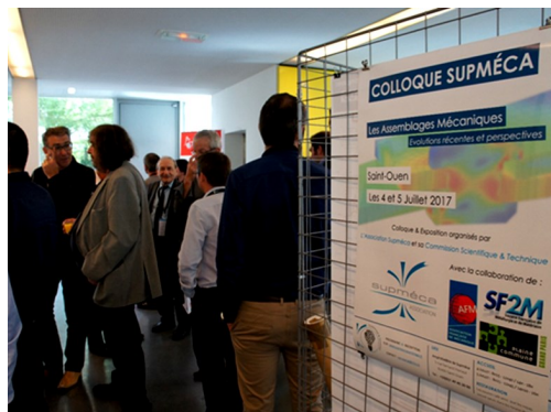
Pendant les pauses...