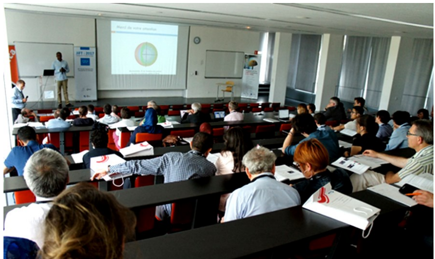
Une assemblée nombreuse et très studieuse