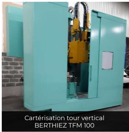
Cartérisation tour vertical BERTHIEZ TFM 100