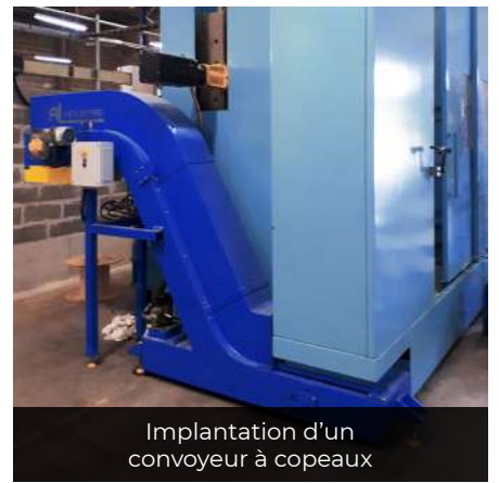
Implantation d'un convoyeur à copeaux