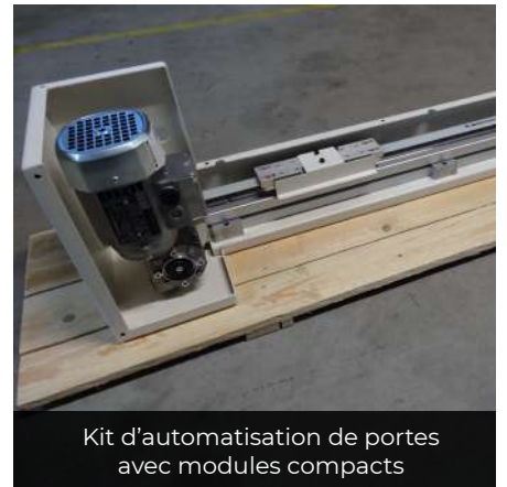
Kit d'automatisation de portes avec modules compacts