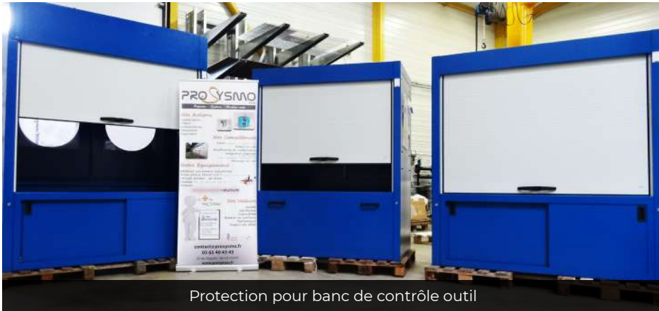
Protection pour banc de contrôle outil