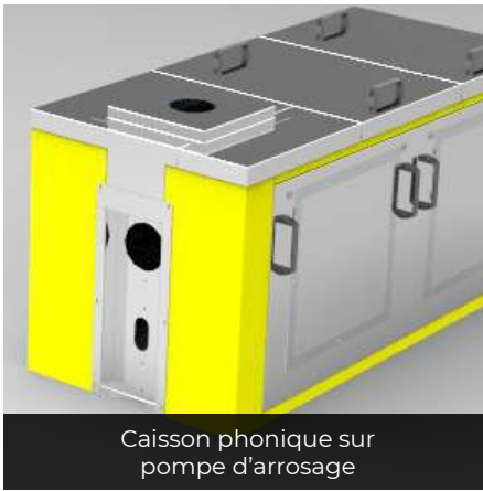
Caisson phonique sur pompe d'arrosage