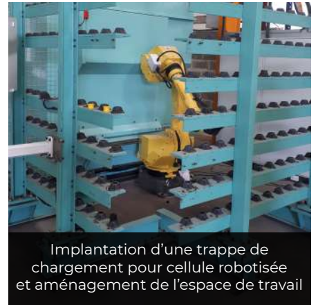
Implantation d'une trappe de chargement pour cellule robotisée et aménagement de l'espace de travail