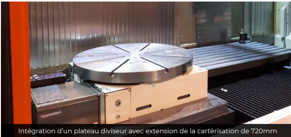
Intégration d'un plateau diviseur avec extension de la cartérisation de 720mm