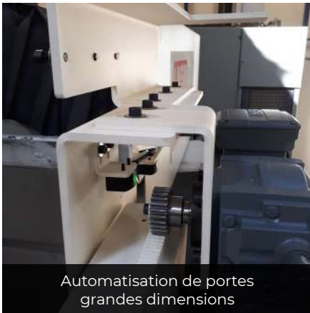
Automatisation de portes grandes dimensions