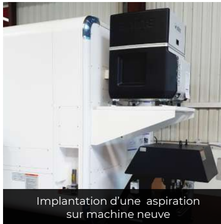
Implantation d'une aspiration sur machine neuve